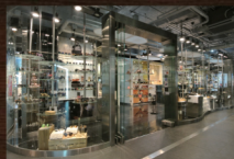
サイアムセンター店