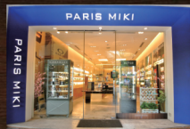
アベニュー・ラチャヨーティン店