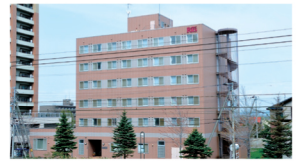
海外からの入学生も安心の本校専用の男子寮・女子寮