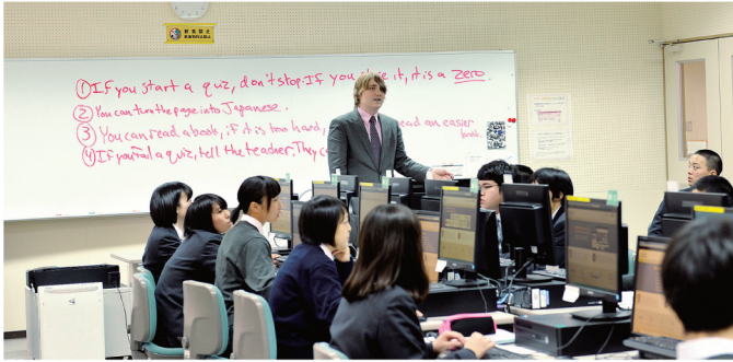
SGH(スーパーグローバルハイスクール)・SSH(スーパーサイエンスハイスクール)指定校