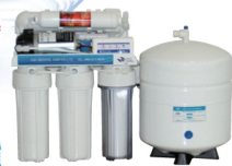
シンク下に収まりキッチン広々のシンク下用逆浸透膜純水器