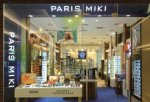
サイアムパラゴン店