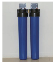
シャワー用 浄水フィルター