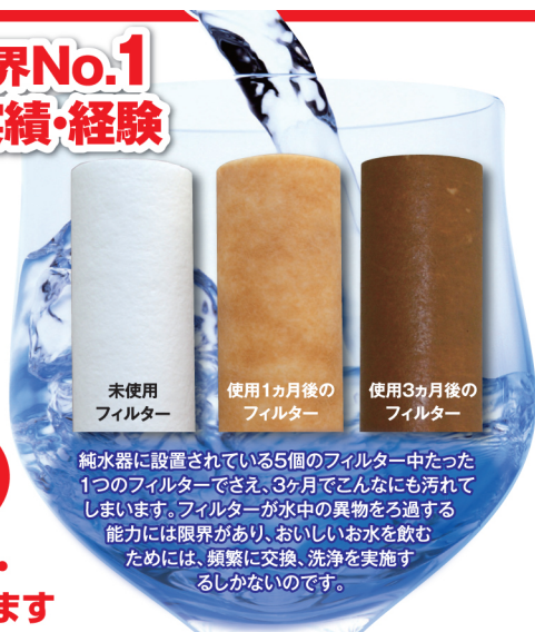
未使用 フィルター