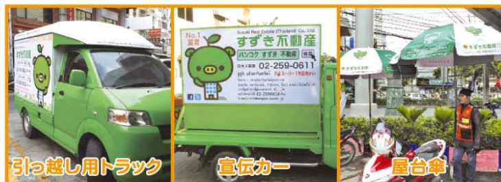
引っ越し用トラック