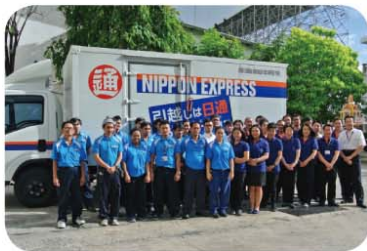
タイ日本通運 引越部