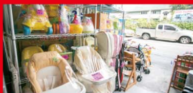
使わなくなったベビー用品も