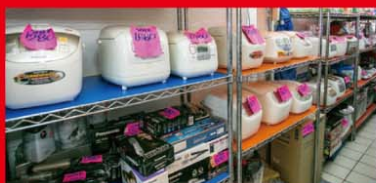
人気の電化製品。捨てる前に、一度ご相談を