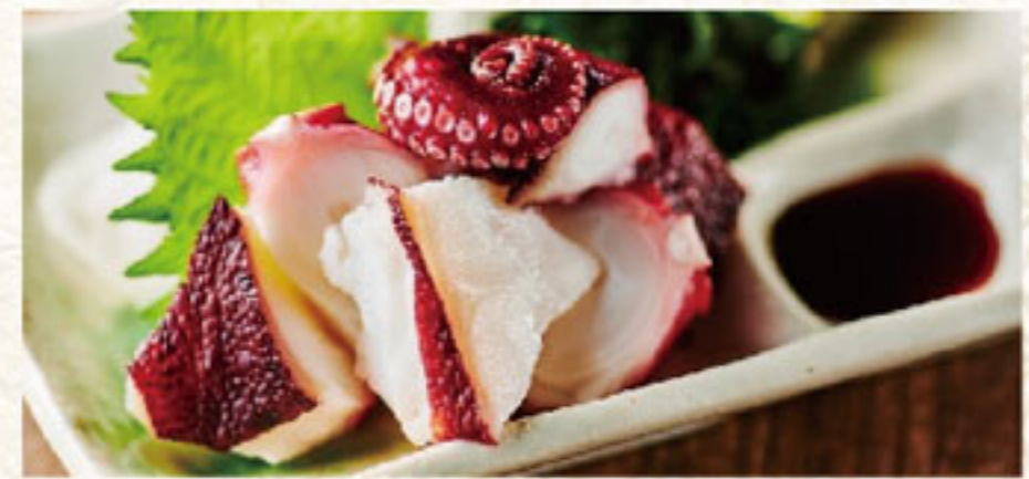
058 タコ刺身 200B Octopus sashimi หนวดปลาหมึกยักษ์