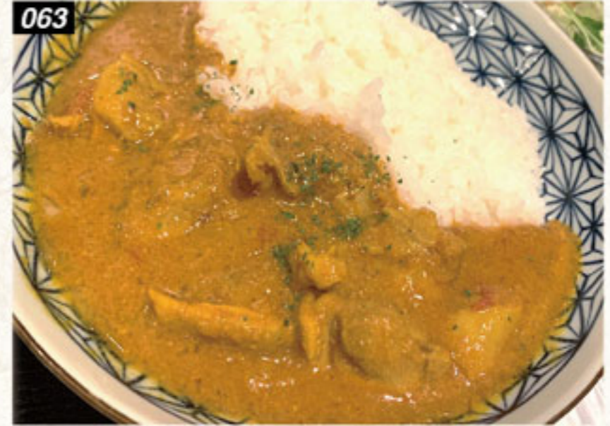
063 スパイシーチキンカレー 250B Spicy chicken curry ข้าวแกงกะหรี่ไก่สไปซี่