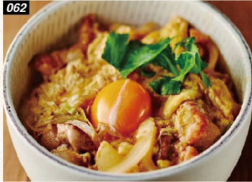
062 親子丼 Chicken and egg bowl ข้าวหน้าไก่ไข่ญี่ปุ่น