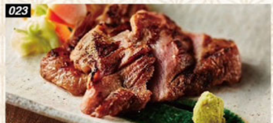
023 牛タン炭火焼き 300B Charcoal grilled beef tongue ลิ้นวัวย่าง