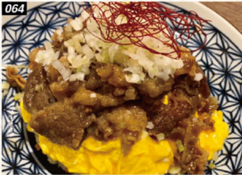
064 牛肉オムチャーン 250B Beef topped omelet fried rice ข้าวผัดเนื้อราดไข่อบมูเสีต