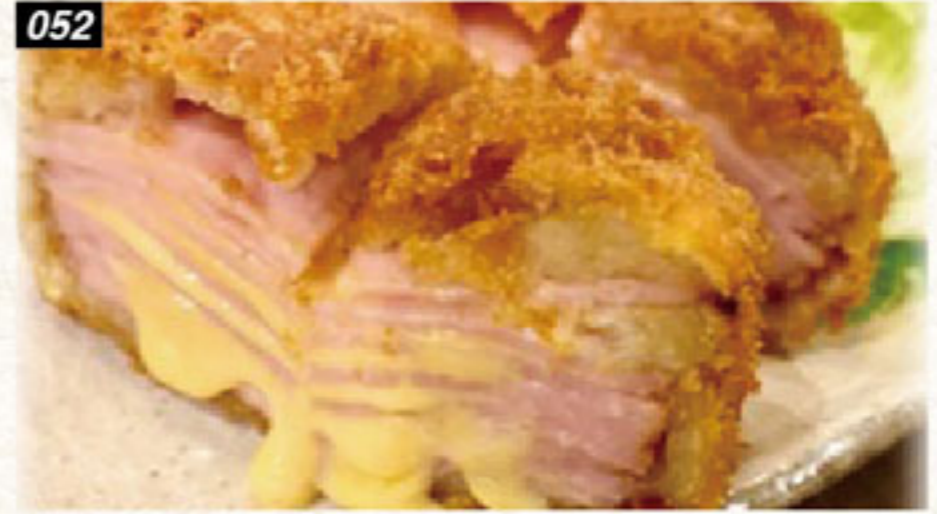
052 ミルフィーユチーズハムカツ 200B Millefeuille hamcheese cutlet แฮมชีสญี่ปุ่นทอดกรอบ