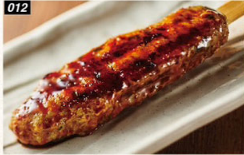
012 手ごねつくね Homemade chicken meatball เนื้อไก่บดโอมเมตย่าง