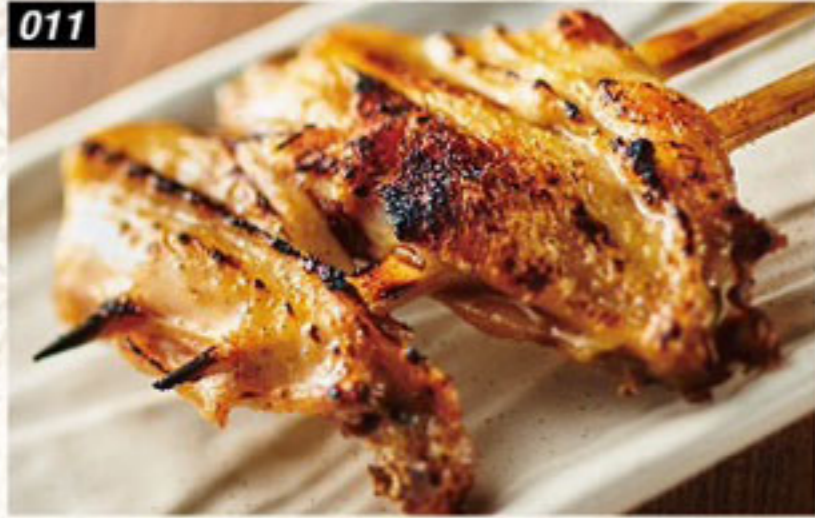
011 手羽先 Wings ปีกไก่ย่าง