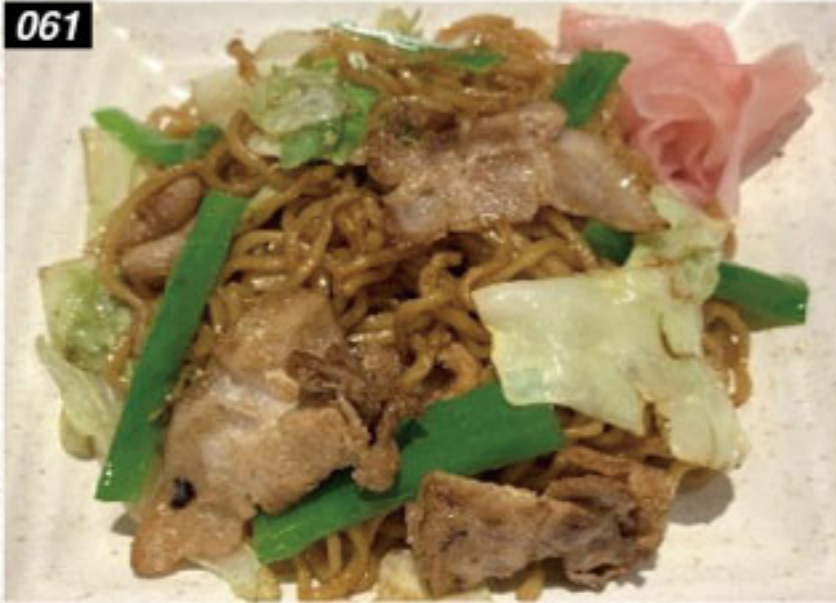
061 焼きそば Stir-fried noodles ผัดก๋วยเตี๋ยว