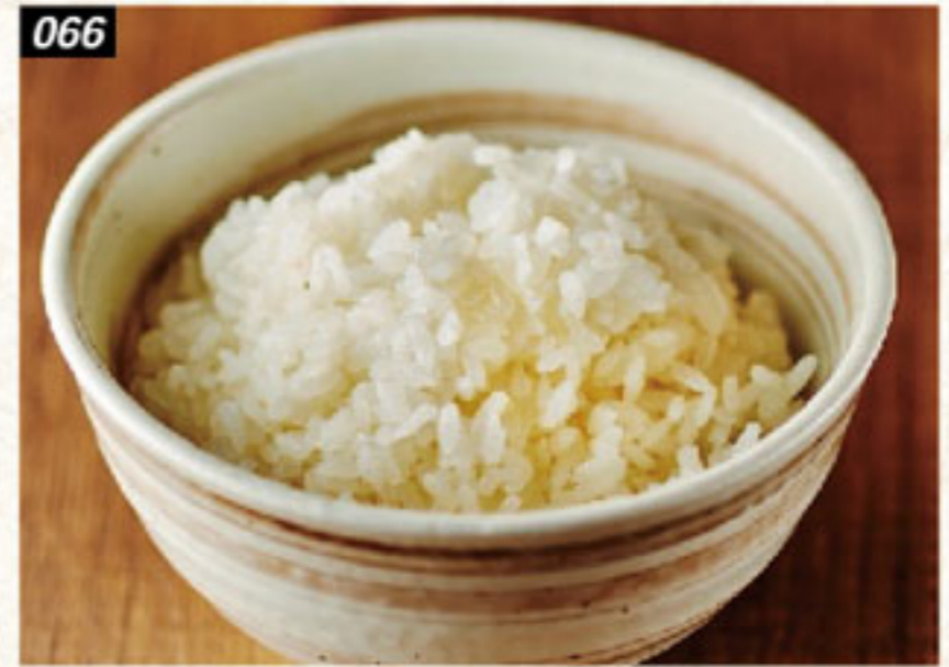
066 白飯 Cooked rice ข้าวสวย