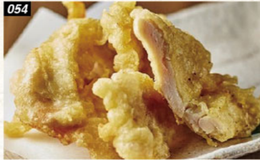
054 鶏の天ぷら 160B Chicken tempura ไกทอดเทมปุระ