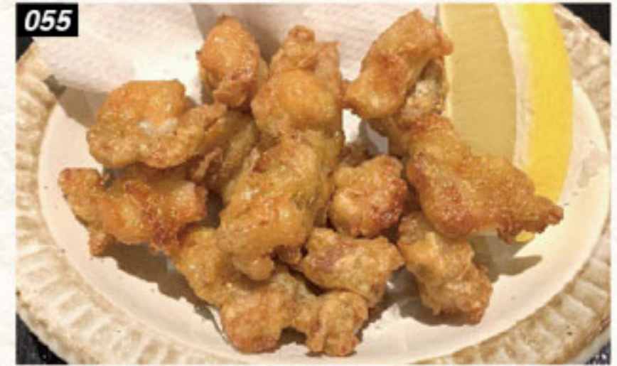
055 鶏ヒザ軟骨の唐揚げ 160B Fried chicken knee cartilage เอ็นขี้ไก่ทอด