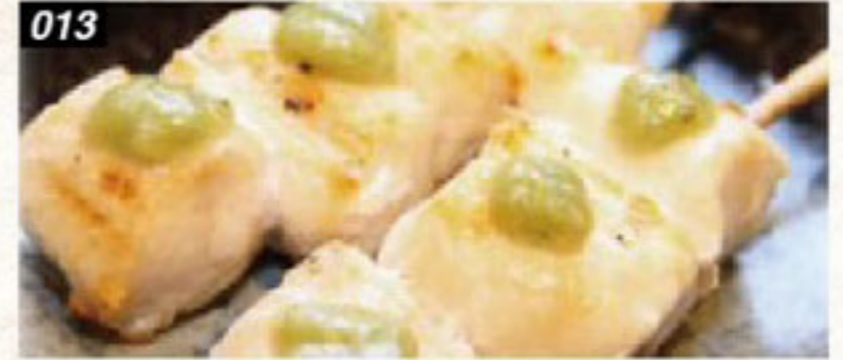
013 ささみ (わさび、柚子胡椒、明太) Chicken fillet (Wasabi, Yuzu pepper, Mentaiko) เนื้ออกไก่ย่าง (วาซาบิ, ส้มยูซุพริกไทย, ไข่ปลาเมนไทโคะ)