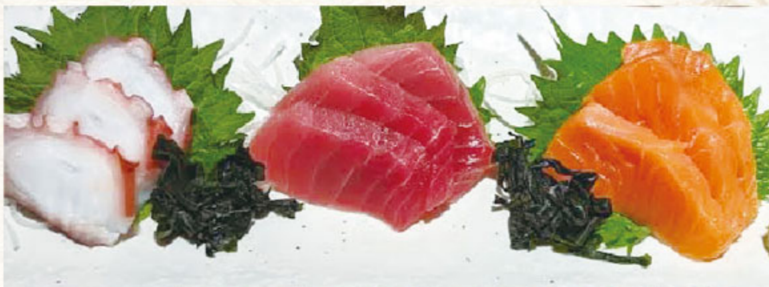
059 刺身3点盛り合わせ 399B Assortment of 3 pieces of sashimi ปลาดิบรวม 3 อย่าง