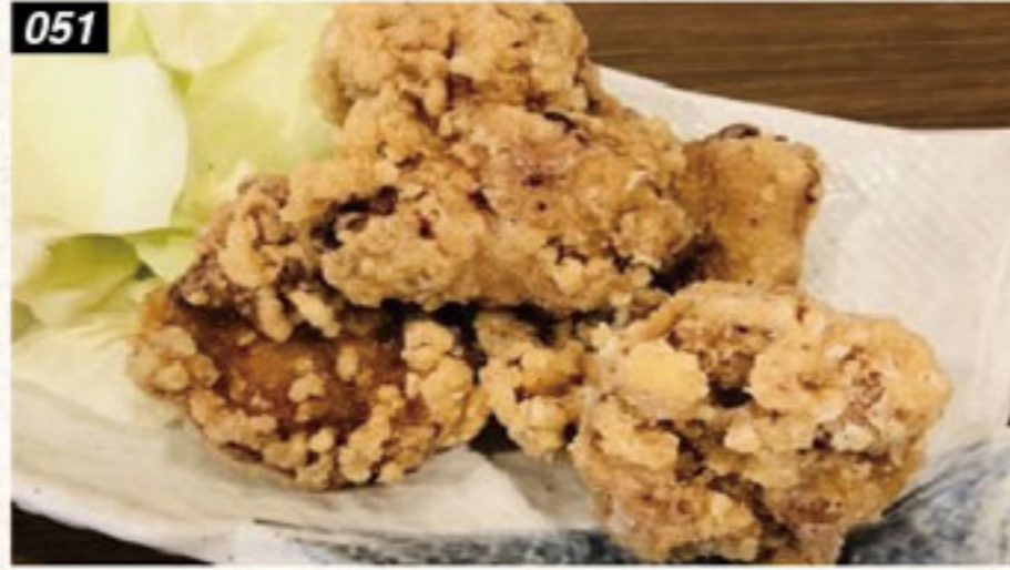
051 鶏唐揚げ 180B Fried Chicken ไกทอดคาราเกะ