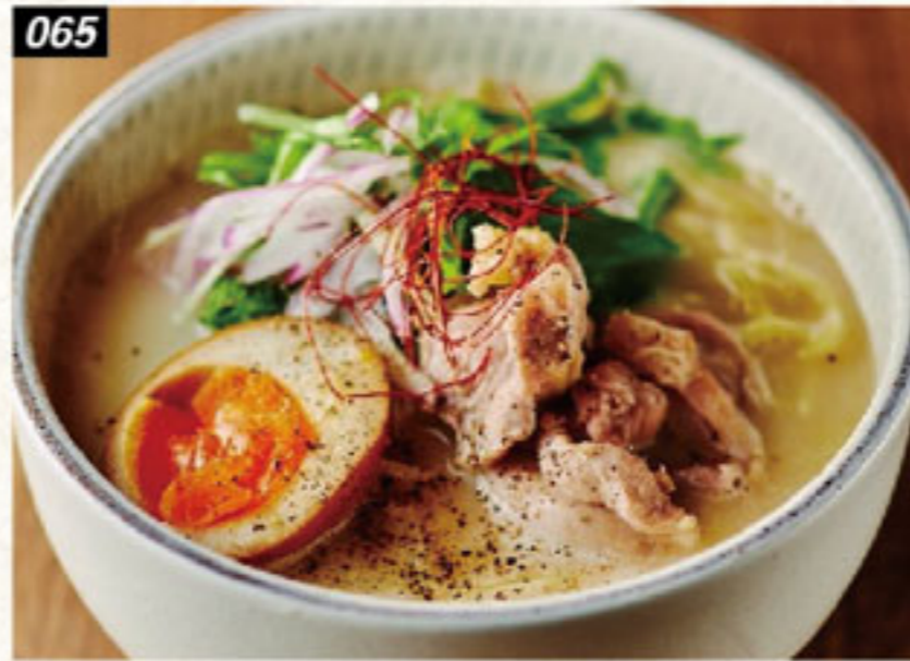
065 鶏白湯ラーメン Chicken ramen ราเมงไก่