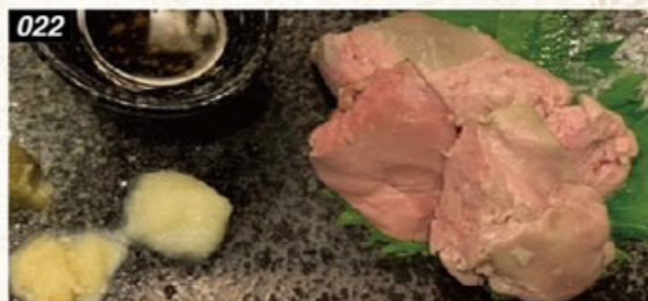
022 鶏ればーコンフィ 180B Chicken liver confit ตับไก่ตุ๋นองพิ