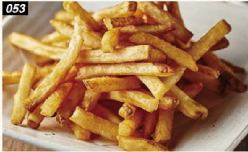
053 ポテトフライ 140B French fries เฟรนช์ฟรายส์