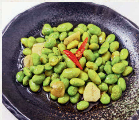
枝豆ペペロンチーノ 109B Aglio e Olio Green Soybeans ถั่วแระญี่ปุ่นผัดพริกกระเทียม