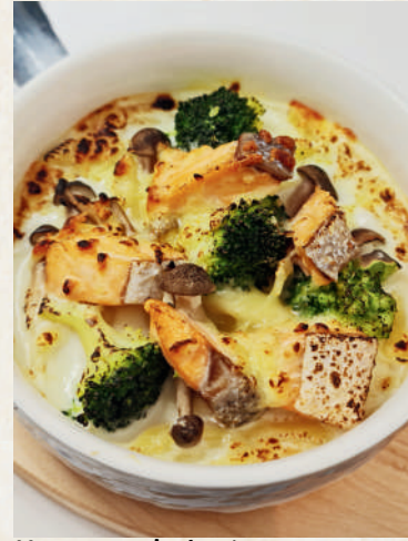
サーモンとキノコの グラタン