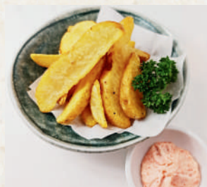
フライドポテト 明太マヨ 139B Fries with Mentaiko Mayo มันฝรั่งทอด ซอสเมนไทโกะ