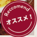
ハンバーグドリア

Hamburg Doria ข้าวอบครีมชีสแฮมเบอร์เกอร์