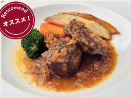
やわらか牛タンシチュー 269B Tender Beef Tongue Stew สตูว์ลิ้นวัว