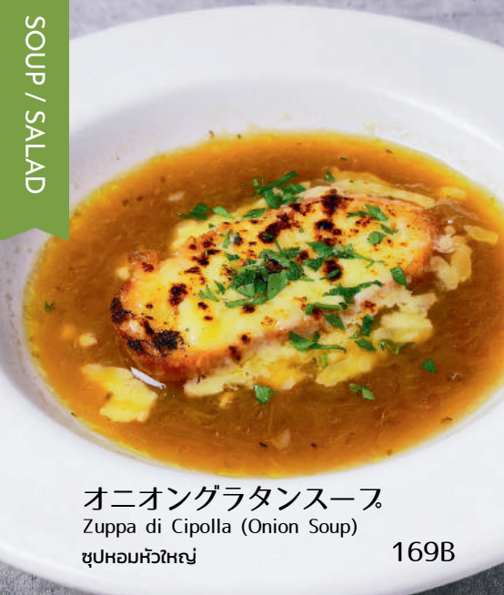
オニオングラタンスープ