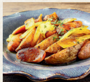
ジャーマンポテト German Fried Potatoes with Whole Grain Mustard 149B มันฝรั่งทอดสไลต์เยอร์มัน