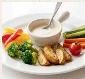
バーニャカウダ Bagna Cauda with salted squid 229B ผักจิ้มซอสแอนโชวีกระเทียม