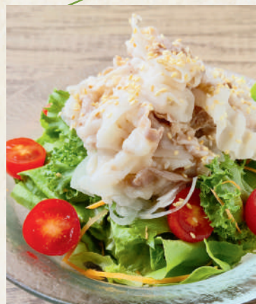
豚冷しゃぶサラダ