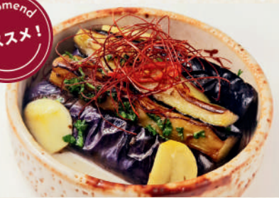
茄子のペペロンチーノ風 119B オイル漬け Grilled Eggplant Garlic Oil มะเขือม่วงดองราดน้ำมันมะกอกกระเทียม