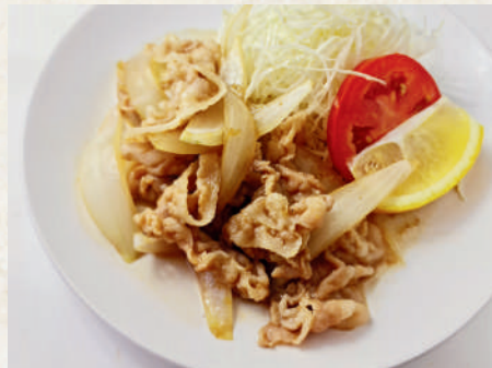
豚しょうが焼き 179B Ginger Grilled Pork หมูผัดขิง