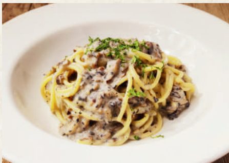
トリュフ薫るキノコの クリームสปาเก็ตตี้ 249B Mushroom Cream Spaghetti with Truffle Aroma สปาเก็ตตี้ครีมซอสเห็ดกลิ่นทรัฟเฟอ