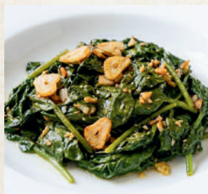
ほうれん草のソテー Sautéed Spinach and salted squid 129B ผักโขมผัดเนย