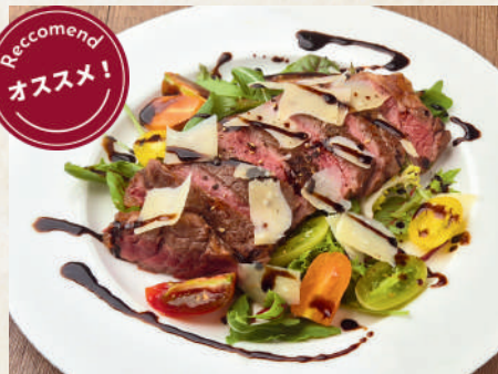
和牛モモ肉のタリアータ 329B Wagyu Beef Round Tagliata เนื้อวากิวส่วนสะโพกย่างหั่นชิ้น