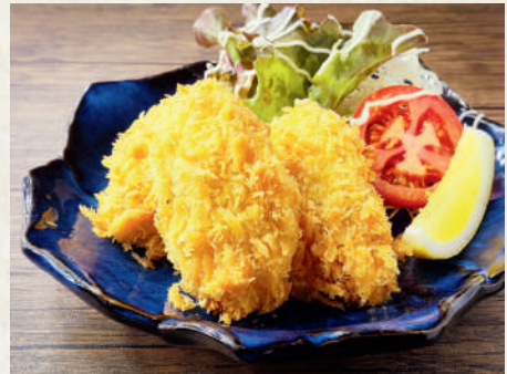
広島産カキフライ 259B