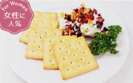
自家製フルーツ クリームチーズ 149B Homemade Fruit Cream Cheese ครั้มชีสผลไม้รวมโฮมเมด