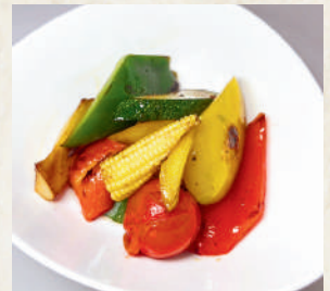
焼き野菜のマリネ 盛り合わせ

Classic Bruschetta บรูสเก็ตต์้าหน้ามะเขือเทศ ขนมปังย่าง หน้ามะเทศคลูกเคล้าน้ำมันมะกอกและใบโหระพา 169B