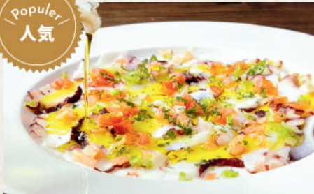
薄切りタコのカルパッチョ 239B Octopus Carpaccio คาร์ปาโชปลาหมึกยักษ์ (สไลซ์บางราดซอส)