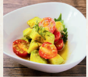
わさびアボカド トマト

Avocado Tomato อะโวกาโดมะเขือเทศคลูกซอสปรุงรส 169B