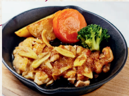
チキンステーキ 209B Chicken Steak สตั๊กไก่