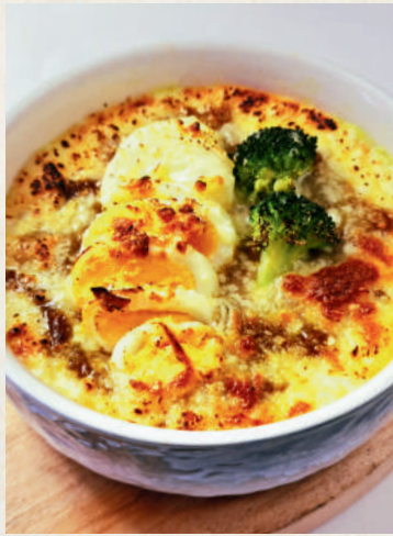
ビーフカレードリア

Beef Curry Doria ข้าวอบครีมชีสแกงกะหรี่เนื้อ