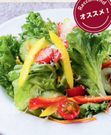
イタリアンサラダ