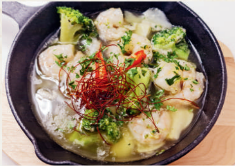
小海老のアヒージョ 219฿ Shrimp Ajillo กุ้งในน้ำมันมะกอกกระเทียม