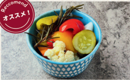
自家製ピクルス 99B Homemade Pickles ผักดองโฮมเมด