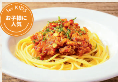
สปาเก็ตตี้มีทソース 259B Spaghetti with Meat Sauce สปาเก็ตตี้มีทซอส