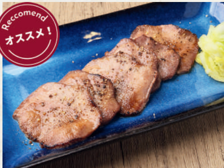
炙り熟成牛タン 299B Seared Aged Beef Tongue ลิ้นวัวย่าง