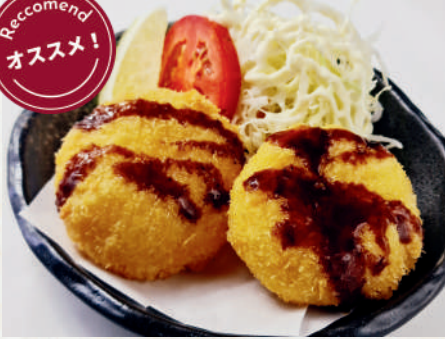
カニクリームコロッケ 189B