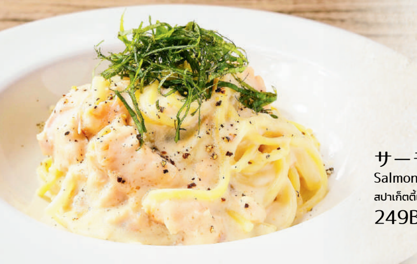
サーモンクリーム Salmon Cream Spaghetti สปาเก็ตตี้แฉลมอนครีม 249B