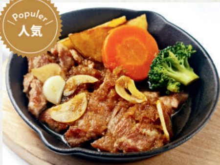
黒豚ポークステーキ 219B Kurobuta Pork Steak สตั๊กหมูคุโรบูตะ