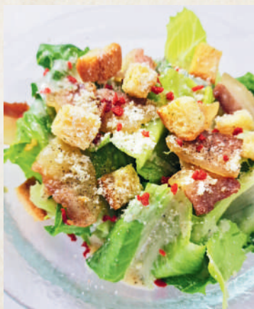
自家製パンチェッタの