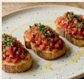
クラシックブルスケッタ

Black Pepper Cashew Nut เม็ดมะม่วงหิมพานต์ซีวี่พริกไทยดำ 89B