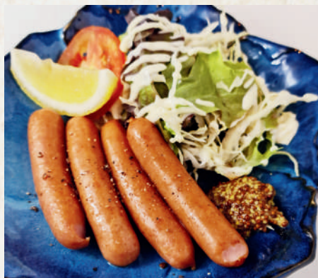
粗挽きソーセージ 149B Japanese Coarse-Ground Sausage ไส้กรอกหยาบ