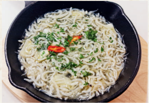
しらすのアヒージョ 189฿ Whitebait Ajillo ปลาขาวสารในน้ำมันมะกอกกระเทียม