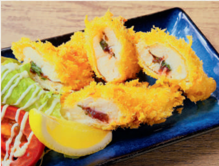
うめささみフライ 159B