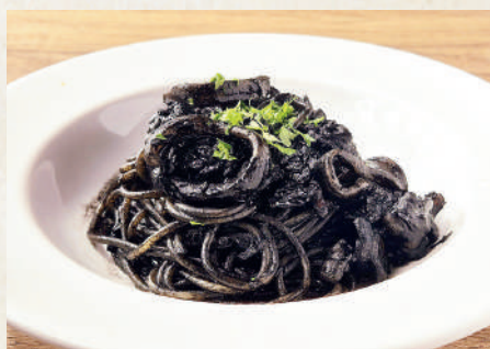
イカ墨のスパゲッティ 269B Spaghetti Squid Ink สปาเก็ตตี้หมึกดำ