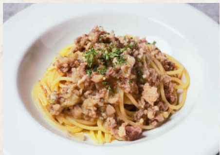
ラグービアンコ 259B (白いมีทソース) Spaghetti Ragù Bianco สปาเก็ตตี้หมูสับไวท์ซอส