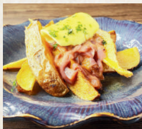
塩辛バターポテト Potatoes with Butter and salted squid 149B มันฝรั่งทอดราดด้วยเนยสดและ ปลาหมึกหมักเค็ม