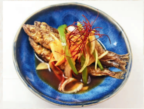
ししゃものエスカベッシュ 149B (南蛮漬け)

Potato Salad with Homemade Pancetta สลัดมันฝรั่งเบคอนโฮมเมด