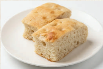
自家製フォカッチャ (2切れ) オリジナル / ガーリック / チーズ Focaccia (2 pieces) Original / Garlic / Cheese 40฿ ขนมปัง (2ชิ้น) ต้นตำรับ / กระเทียม / ชีส