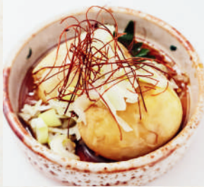
やみつき悪魔の 煮卵

Seasoned Boiled Egg ไข่ต้มซีวี่ปรุงรส 99B