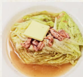
蒸しキャベツの 塩辛風味 159B Cabbage Butter with Salted Squid กะหล่ำปลีนึ่งเนยสดหน้าปลาหมึกหมักเค็ม