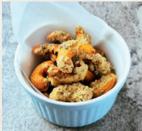
カシューナッツ 黒胡椒風味

Avocado Tomato อะโวกาโดมะเขือเทศคลูกซอสปรุงรส 169B