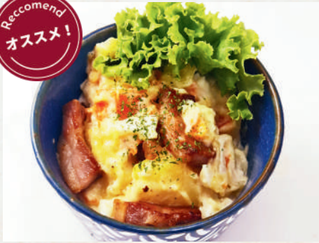
自家製パンチェッタ 119B ポテトサラダ

Potato Salad with Homemade Pancetta สลัดมันฝรั่งเบคอนโฮมเมด