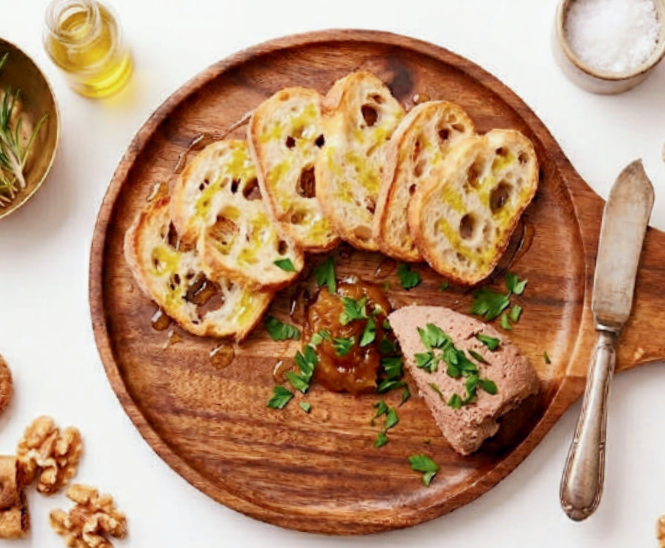
自家製レバーパテ Homemade Liver Pate ตับสดโฮมเมด 159B